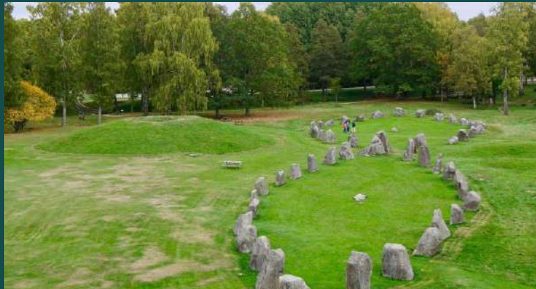
Αρχαιολογικός χώρος Anundshög