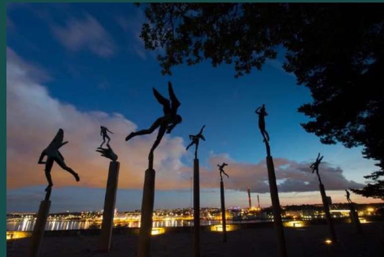
Millesgården Museum Μουσείο Τέχνης