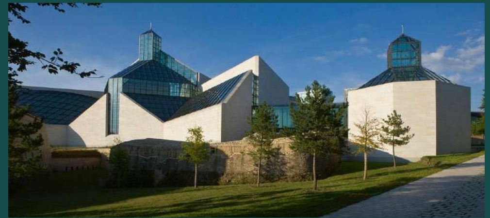
Mudam - Μουσείο μοντέρνας τέχνης