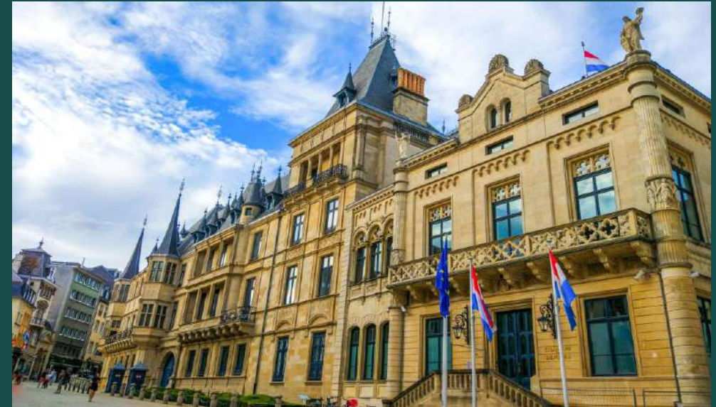
Grand Ducal Palace (Το μεγάλο παλάτι του Δούκα)