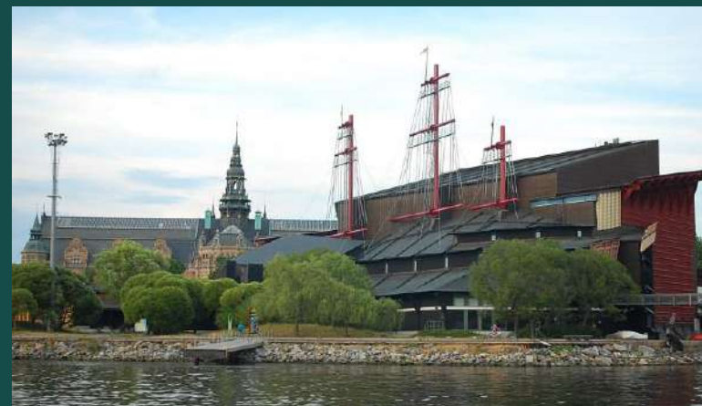
Museo-di-vasa Μουσείο Ιστορίας